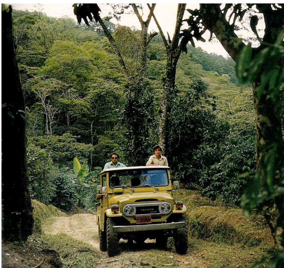
Lavoura de café sombreada em Honduras

Mais de 80% das áreas de produção hondurenhas têm menos de 10 hectares e 98% do cultivo é feito sob sombra, apesar de haver tendência de diminuição na densidade do sombreamento visando aumento de produtividade. As lavouras de café são mais adensadas que as brasileiras com, em média, cerca de 4.000 plantas por hectare. Segundo o IHCAFE (Instituto Hondurenho do Café), 270 mil hectares são cultivados com café no país, com produtividade média na casa de 14,5 sacas por hectare. As variedades mais cultivadas são típica, bourbon, catuaí, caturra, parainema e lempira.