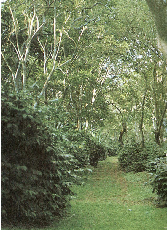
Lavoura de café sombreada na Nicarágua